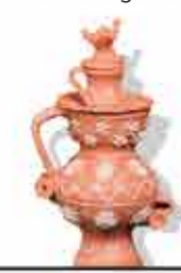
Cantarinha dos Namorados [Jarra de los enamorados]

El colorido gallo de Barcelos, icono de la cultura portuguesa conocido en todo el mundo y guardián de una leyenda de justicia y suerte, transmite el alma y la tradición del Figurado de Barcelos.