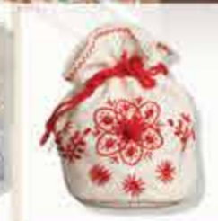
Bordado de Guimarães

El bordado de tamiz de São Miguel da Carreira es un bordado blanco en el que gran parte del lino base se desenreda, formando una red abierta sobre la que se bordan los motivos.