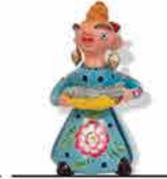
Figurado de Barcelos

Con sus vivos colores y delicados motivos, son testimonio de la artesanía de la porcelana pintada a mano y de la creatividad de la artesanía de Minho.