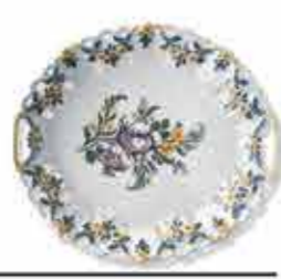
Loza de Viana do Castelo

Con sus vivos colores y delicados motivos, son testimonio de la artesanía de la porcelana pintada a mano y de la creatividad de la artesanía de Minho.