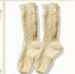
Calcetines de lana

“Sólo en el lino podemos encontrar el alma del Minho”. Desde tiempos inmemoriales, el lino se trabaja en todos los municipios del Minho, desde Valença hasta Terras de Bouró.