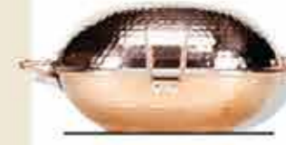
Cataplana de cobre

Cada vez más raro, el arte de trabajar el cobre para crear utensilios o piezas decorativas es una de las expresiones más elocuentes de la artesanía tradicional del Minho, con especial atención al municipio de Vieira do Minho.