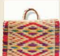
Cesta de junco

Tradicionales, coloridas, reutilizables y biodegradables, las cestas de junco de Forjães se han convertido en un codiciado accesorio de moda.