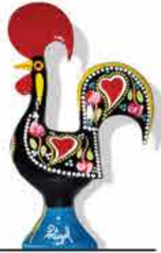
Gallo de Barcelos

La alfarería y la cerámica del Minho son expresiones vibrantes de la rica tradición artesanal de esta región de Portugal. Las piezas, marcadas por la habilidad manual y la conexión con la tierra, reflejan la historia y la identidad cultural de la gente del Minho.