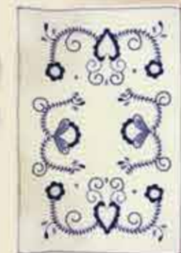
Bordado de Viana

En Minho, la preservación del saber hacer y la renovación de la producción artesanal se combinan con la innovación y la modernidad.