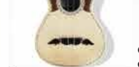
Cavaquinho de Portugal

No hay fiesta o romería en el Minho en la que el bombo no haga acto de presencia y anime la celebración con su estridente sonido. Todavía hay personas que fabrican este instrumento a mano en Guimarães y Vila Nova de Cerveira.