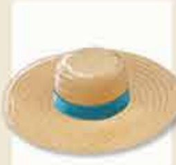
Trenza de paja

Tradicionales, coloridas, reutilizables y biodegradables, las cestas de junco de Forjães se han convertido en un codiciado accesorio de moda.