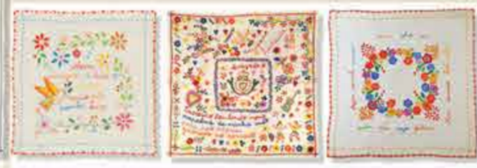
Pañuelos de los enamorados

El bordado de Viana do Castelo surgió en el siglo XIX y decora principalmente manteles y caminos de mesa. Árboles japoneses, tréboles, flores y corazones son los motivos principales.