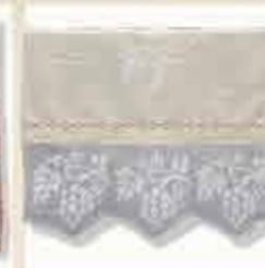
Bordado en tamiz

Los pañuelos de los enamorados o pañuelos de pedida, una tradición del Minho del siglo XIX originaria de Vila Verde, eran pañuelos bordados en punto de cruz por chicas en edad de salir. La chica bordaba un pañuelo de lino con motivos y frases amorosas, predominantemente corazones, flores y pájaros, y se lo regalaba a su enamorado. Si éste lo llevaba en público, era señal de amor correspondido y de un probable final feliz. El éxito fue tal que hoy inspiran diversos productos, textiles y de otro tipo.